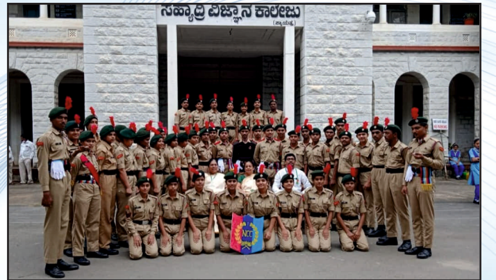
ಸ್ವಾತಂತ್ರ್ಯೋತ್ಸವ ದಿನಾಚರಣೆಯಲ್ಲಿ ಎನ್.ಸಿ.ಸಿ. ಕೆಡಿಟ್ಸ್