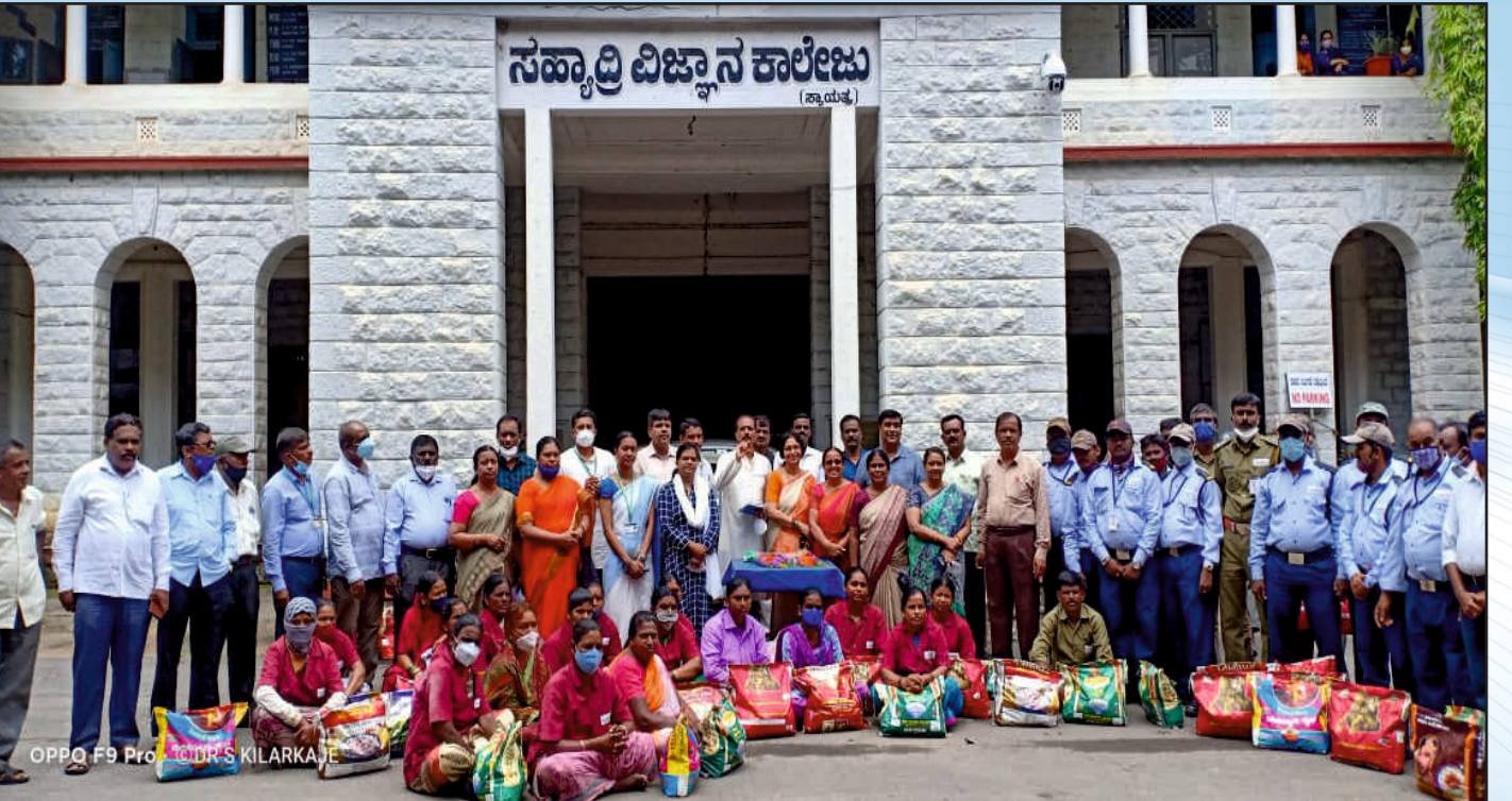
ಡಿ. ದರ್ಜೆ ನೌಕರರಿಗೆ ಕಾಲೇಜಿನ ಶಿಕ್ಷಕ ವೃಂದದವರಿಂದ ಆಹಾರ ಕಿಟ್ ವಿತರಣೆ