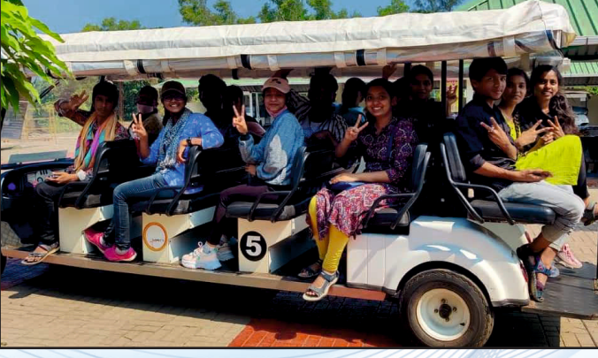
ಪಾಢ್ಲೇಸ್ ವಿದ್ಯಾರ್ಥಿಗಲಿಂದ ಪಿಲಿಕುಳ ನಿಸರ್ಗಧಾಮಕ್ಕೆ ಬೇಟೆ