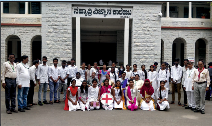
ಸ್ವಾತಂತ್ರ್ಯೋತ್ಸವ ದಿನಾಚರಣೆಯಲ್ಲಿ ರೆಡ್ ಕ್ರಾಸ್ ಸದಸ್ಯರು