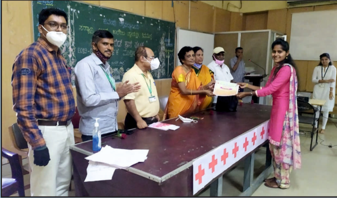
ರೆಡ್ ಕ್ರಾಸ್ ವತಿಯಿಂದ ಪ್ರಮಾಣಪತ್ರ ವಿತರಣೆ