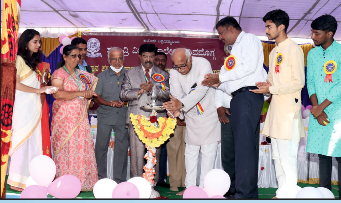
ವಿಜ್ಞಾನ ಪರಿಷತ್ ಉದ್ಘಾಟನಾ ಸಮಾರಂಭ