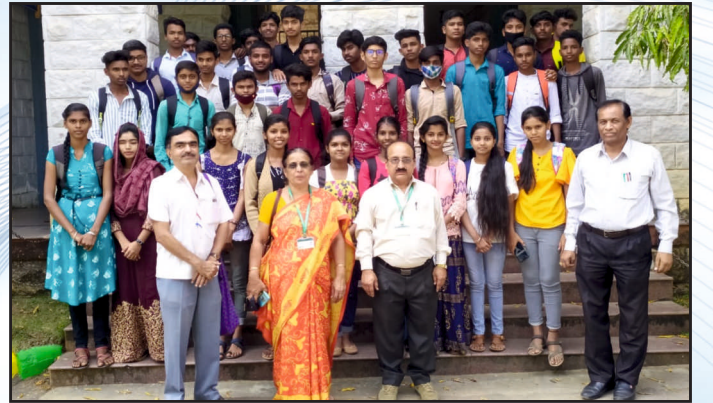
ಡಿ.ವಿ.ಎಸ್. ಪಾಲಿಟೆಕ್ನಿಕ್ ವಿದ್ಯಾರ್ಥಿಗಳು ಭೂ ವಿಜ್ಞಾನ ವಿಭಾಗಕ್ಕೆ ಬೇಟಿಕೊಟ್ಟ ಸಂದರ್ಭ