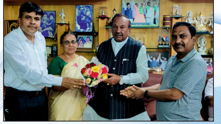
ಜಿಲ್ಲಾ ಉಸ್ತುವಾರಿ ಸಚಿವರಿಗೆ ಅಭಿನಂದನೆ