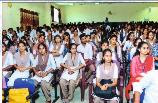
Placement Cell Activities