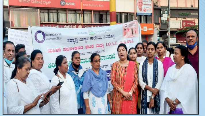
ವಿಶ್ವ ಮಹಿಲಾ ದಿನಾಚರಣೆ