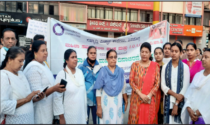
ವಿಶ್ವ ಮಹಿಳಾ ದಿನಾಚರಣೆ