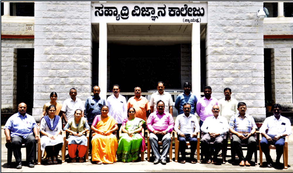
NON TEACHING STAFF