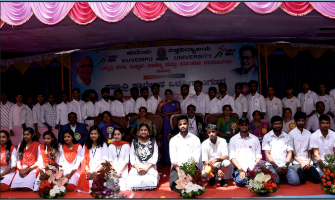
ಶಿಲಾನ್ಯಾಸ ಸಮಾರಂಭದಲ್ಲಿ ಕಾಲೇಜು ವಿದ್ಯಾರ್ಥಿಗಳು