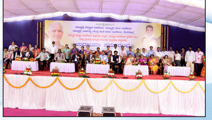
ಒಳಾಂಗಣ ಕ್ರೀಡಾಂಗಣ ಉದ್ಘಾಟನಾ ಸಮಾರಂಭ