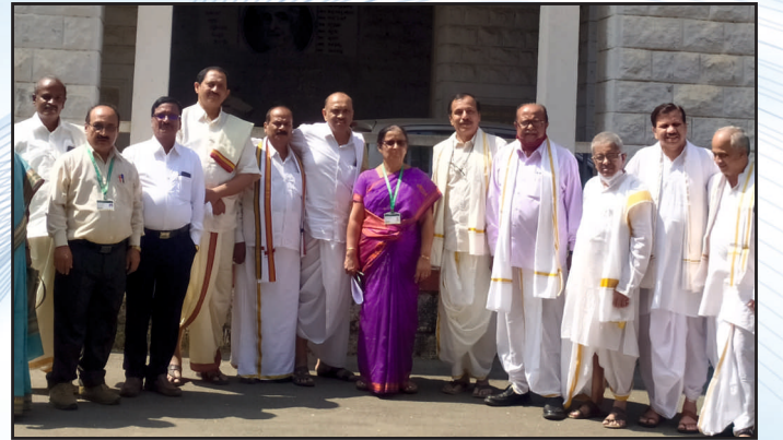
ಕಾಲೇಜಿನ ಹಿರಿಯ ವಿದ್ಯಾರ್ಥಿಗಳು ಬೇಟೆ ನೀಡಿದ ಸಂದರ್ಭ