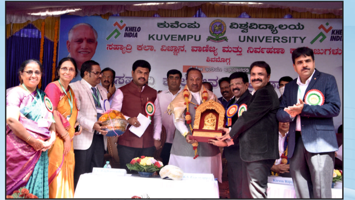
ಶಿಲಾನ್ಯಾಸ ಸಮಾರಂಭದಲ್ಲಿ ಸಚಿವರಿಗೆ ಸನ್ಮಾನ