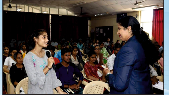
ಪಾರ್ಟ್ನೇರ್ಸ್ ವತಿಯಿಂದ ಸಂವಾದ ಕಾರ್ಯಕ್ರಮ