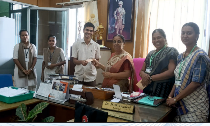
ಐ.ಕ್ಯೂ.ಎ.ಸಿ. ವತಿಯಿಂದ ನಡೆದ ಪತ್ರಲೇಖನ ಸ್ಪರ್ಧೆಯಲ್ಲಿ ವಿಜೇತರು