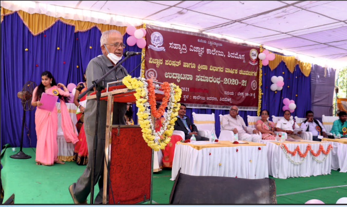
ಮುಖ್ಯ ಅತಿಥಿಗಳಿಂದ ಭಾಷಣ