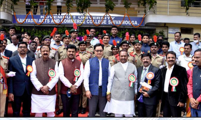
ಶಿಲಾನ್ಯಾಸ ಸಮಾರಂಭದಲ್ಲಿ ಅತಿಥಿಗಳು