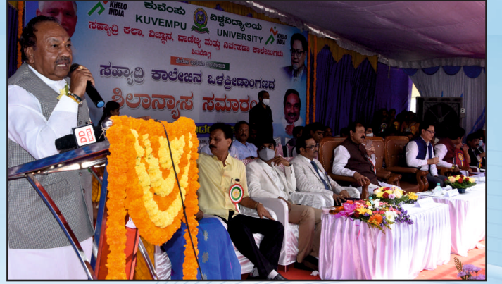
ಮುಖ್ಯ ಅತಿಥಿಗಳಿಂದ ಭಾಷಣ