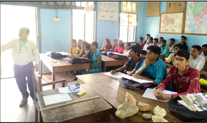
ಭೂವಿಜ್ಞಾನ ವಿಭಾಗದಿಂದ ಉಪನ್ಯಾಸ