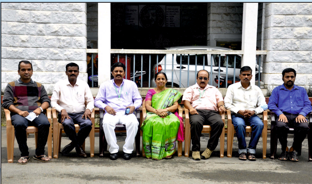
NSS GOVERNING BODY