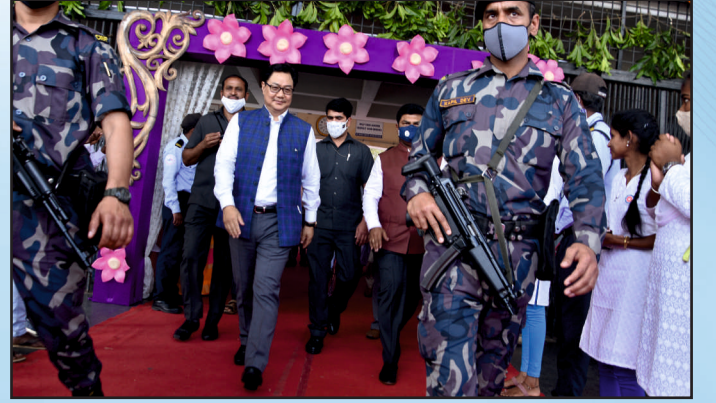
ಶಿಲಾನ್ಯಾಸ ಸಮಾರಂಭಕ್ಕೆ ಕೇಂದ್ರ ಸಚಿವರ ಆಗಮನ