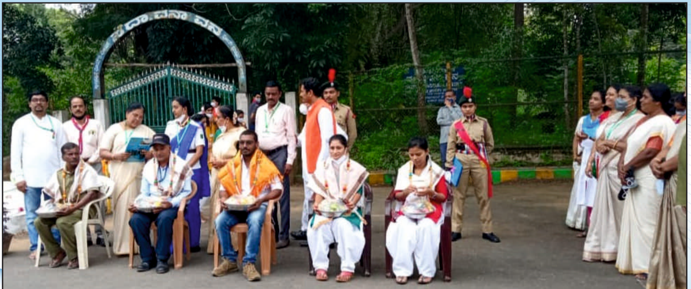
75ನೇ ಸ್ವಾತಂತ್ರ್ಯೋತ್ಸವ ದಿನಾಚರಣೆಯಲ್ಲಿ ಕೋವಿಡ್ ಲಾಕ್‌ಡೌನ್ ಸಮಯದಲ್ಲಿ ನಿರಂತರ ಸೇವೆ ಸಲ್ಲಿಸಿದ ಕೋವಿಡ್ ವಾರಿಯರ್‌ಗಳಿಗೆ ಸನ್ಮಾನ