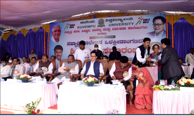
ಶಿಲಾನ್ಯಾಸ ಸಮಾರಂಭದಲ್ಲಿ ಅತಿಥಿಗಳು