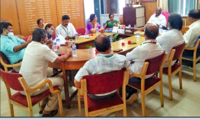
ಸಹ್ಯಾದ್ರಿ ವಿಜ್ಞಾನ ಕಾಲೇಜಿನ ಹಿರಿಯ ವಿದ್ಯಾರ್ಥಿಗಲ ಕಾರ್ಯಕಾರಿ ಮಂಡಲಿ ಸಭೆ